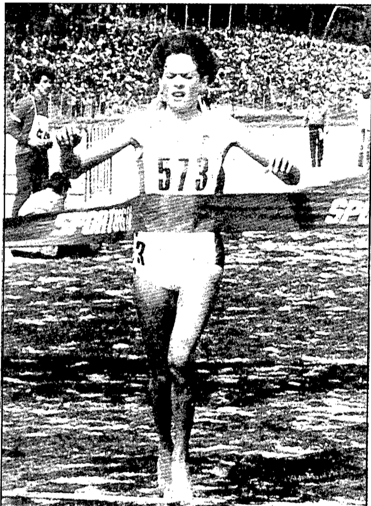
La mediofondista mundial Zola Budd cruzando la línea de meta en una competición internacional.

El comunicado hecho público por la atleta señalaba: «La presión de los últimos acontecimientos ha afectado mi salud hasta el punto de que en la actualidad no me siento con fuerzas para competir. Mis médicos me han dicho que sufro de agotamiento nervioso y que ne-