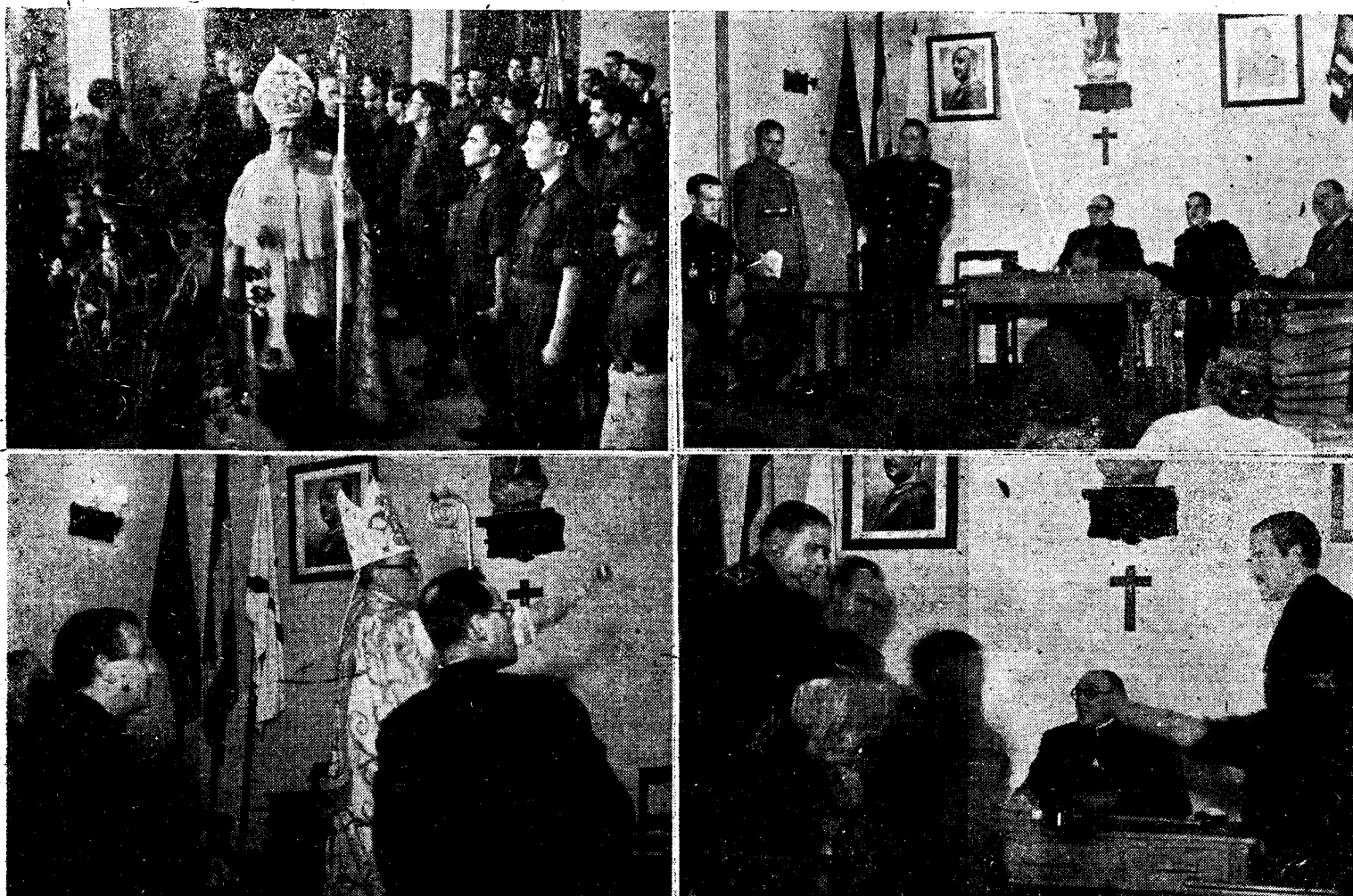
A la derecha, dos momentos de la bendición del Hogar.—A la izquierda, el gobernador civil durante su discurso y el acto de entrega de donativos a los humildes del barrio de San José.